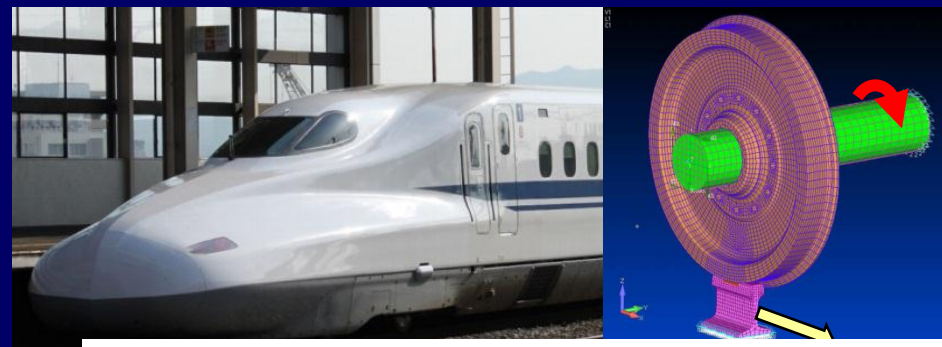
高速走行列車のレール・車輪間の動的接触